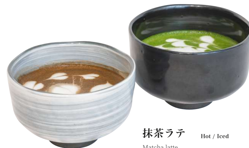
抹茶ラテ Matcha latte

白あんホイップクリームにほうじ茶、抹茶をトッピング。暑い季節にオススメの程よい甘さの大人なスムージー。