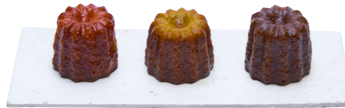
Plain プレーン Matcha 抹茶 Roasted green tea ほうじ茶