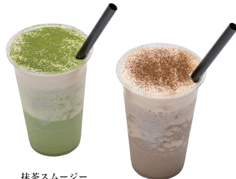
抹茶スムージー Matcha Smoothie