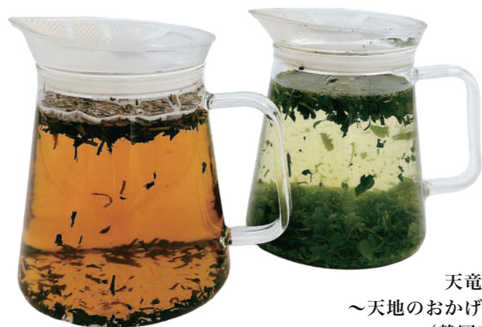
天竜茶 ～天地のおかげ～ (静岡産)